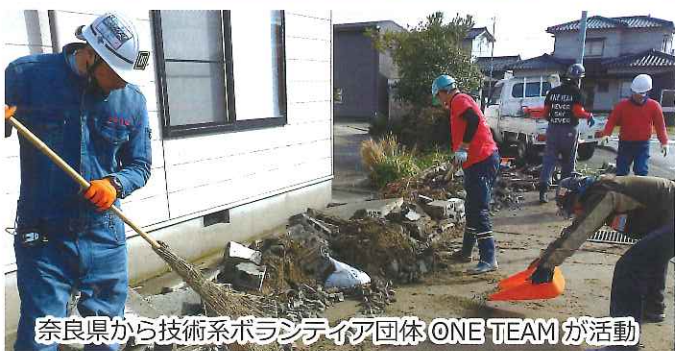
奈良県から技術系ボランティア団体 ONE TEAM が活動