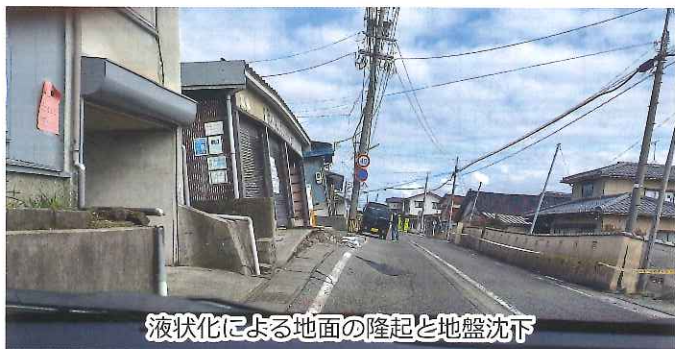
液状化による地面の隆起と地盤沈下

埼玉県社会福祉協議会は、石川県かほく市と内灘町の災害ボランティアセンターに職員4名を先遣派遣しました。小川町からそのメンバーとして内灘町に1名を2月8日～14日（7日間）派遣しました。現地の状況は大変難しく、被災者からの相談傾聴、現地調査、長引く可能性のあるセンター運営確立等の支援を行いました。