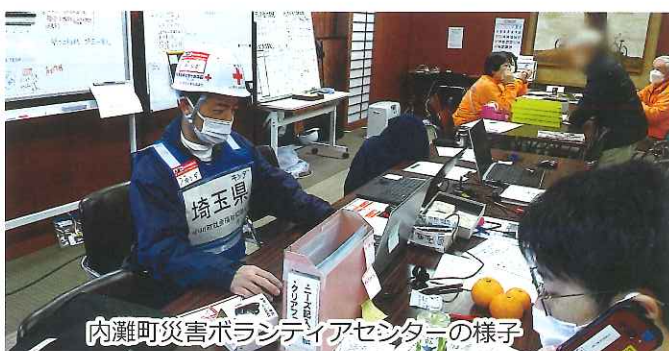
内灘町災害ボランティアセンターの様子