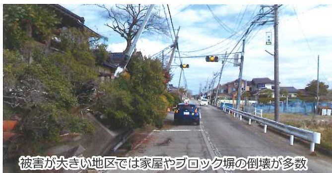
被害が大きい地区では家屋やブロック塀の倒壊が多数