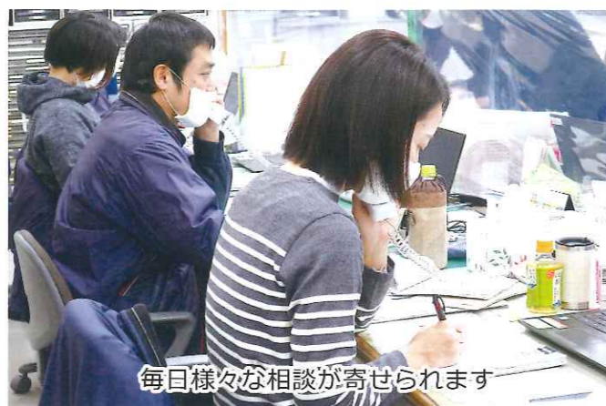
毎日様々な相談が寄せられます

どうしても相談することが難しい場合は、町と連携した「認知症初期集中支援チーム」として対応し、医師に直接訪問をしていただく場合もあります。