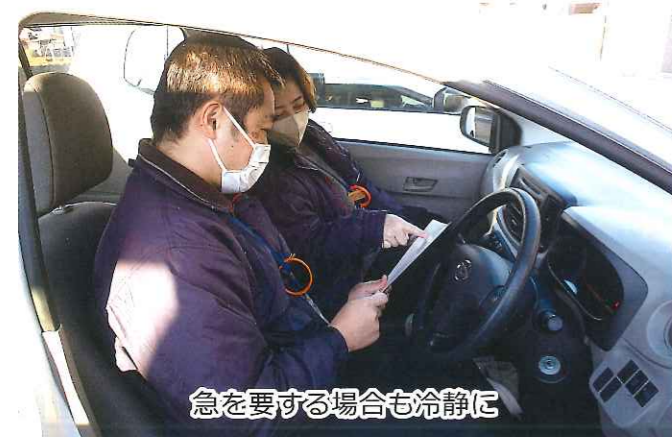
急を要する場合も冷静に