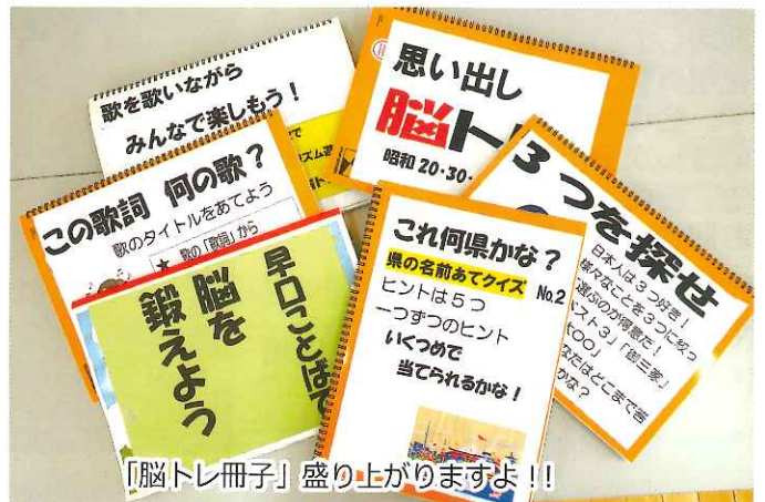
「脳トレ冊子」盛り上がりませよ!!