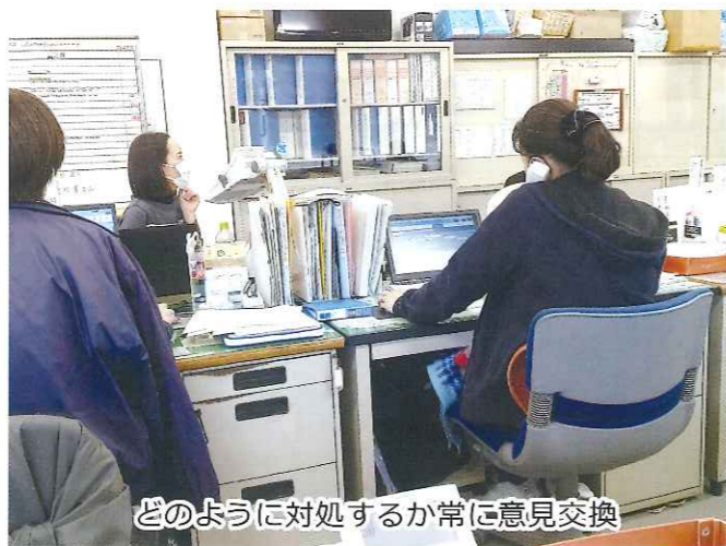
どのように対処するか常に意見交換