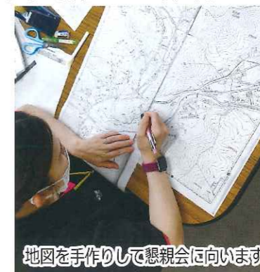
地図を手作りして懇談会に向います

社協職員が地域に出向き、区長、民生委員・児童委員、地域福祉委員など地域を支える方々と地域の福祉課題や見守りについての話し合いを行います。