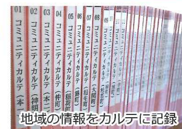
地域の情報をカルテに記録